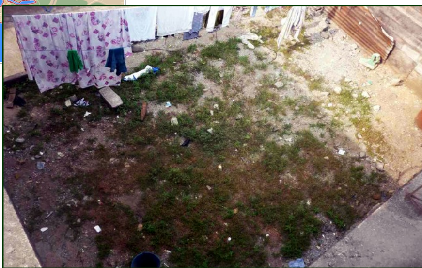
Lieu retenu pour la première micro-ferme avicole, sur sol naturel, en plein cœur d'Abidjan.